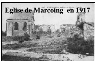
Eglise de Marcoing en 1917

Voilà un siècle le 20 novembre 1917, éclatait la tragique Bataille de Cambrai, notre village et tous ceux des alentours se retrouvèrent sous un déluge de feux, de sang et de destructions. Durant 17 jours ce fut l'enfer.